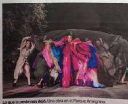
Lo que la peste nos dejó. Una obra en el Parque Ameghino.

La epidemia de la fiebre amarilla vuelve a resurgir en el Parque Ameghino, que supo ser, hace muchos años, el primer cementerio del sur. Y la trae el grupo de teatro comunitario Pompapetriyazos. Vecinos del barrio de Parque Patricios, para esta obra decidieron "escuchar las historias que el parque tenía para contar, y resignificarlas poéticamente". El resultado es Lo que la peste nos dejó , un espectáculo que se puede ver todos los sábados a las 21 (hasta el 17/12) en el corazón del parque que, bajo la luna, nos permite ir y venir en el tiempo de la mano de 50 actores y música en vivo. La historia: un simulacro de filmación de una película en vivo realizada por payasos y en el que se incluye al espectador como extra, con el parque y sus historias como testigos en el medio de la noche.