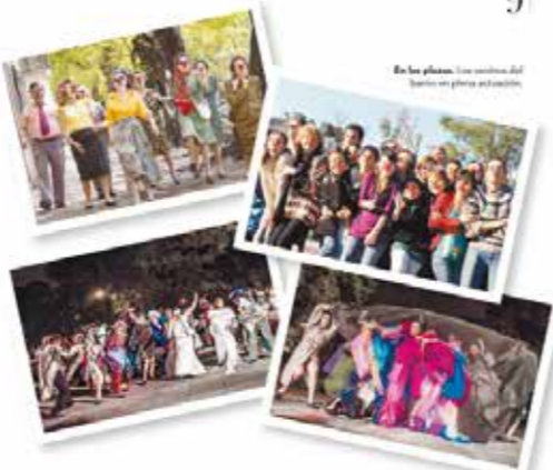
En las plazas, los vecinos del barrio se ponen a actuar.