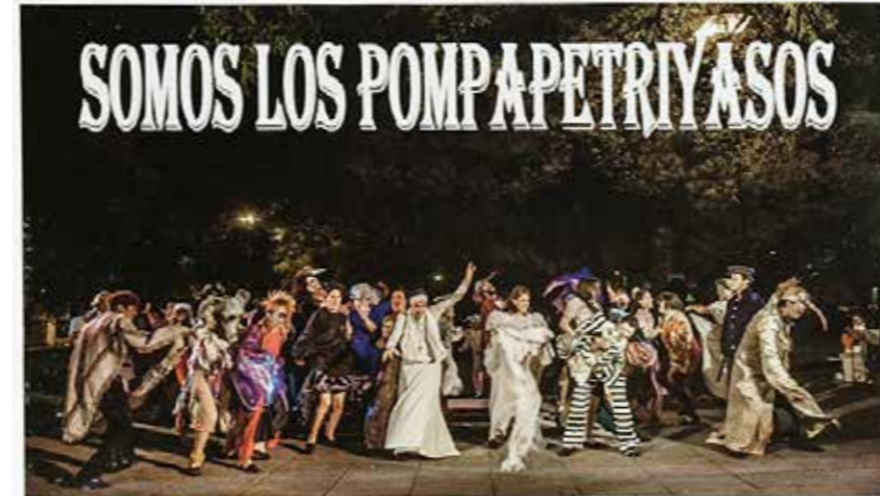
Gracias chicos. Felices 15 años, el barrio los saluda con un abrazo de oso. Se nos ocurrió regalarles un poema de un gigante: de Hamlet Lima Quintana

Participan de la movida del espacio en diferentes proyectos gente de todas las edades y creemos no equivocarnos si decimos que todos y cada uno potencian en su participación el niño que llevamos adentro y que ojalá nunca nos deje. Entonces teniendo en cuenta todo esto, era casi imposible pensar en otro nombre que suene con tanta fuerza.