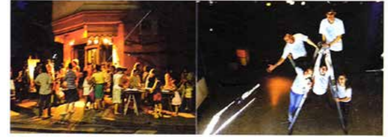
TODA UNA HISTORIA; TODO UN PASADO; TODO UN PRESENTE Y UN FUTURO PLENO DE PROYECTOS Y REALIZACIONES

Quando trabajamos la idea de esta merecida nota, nos encontramos una mañana en la sede del grupo de teatro comunitario "POMPAPETRIYASOS" en la esquina de Av. Brasil y Esteban de Luca de nuestro barrio Parque de los Patricios, en busca de material. Sabiendo igual que ellos poseen una hermosa página en internet llena de textos y fotografías, pero era necesario transmitir un contacto personal ya que este es un espacio donde los dueños del arte juegan y juegan. En medio de la charla con quien se ocupa de la prensa del grupo, un señor joven con sus dos hijos, se acercó a preguntar por las actividades del lugar y recibió gratuitamente la información de las muchas tareas con las que el grupo convoca la ilusión de los chicos. Recordamos que una vez alguien dijo "el mundo es de los jóvenes pero por sobre todo de los más jóvenes", de los niños, por quienes, los POMPAPETRIYASOS se juegan día a día logrando a través de su arte que esos niños fortalezcan su identidad familiar, su pertenencia al barrio.