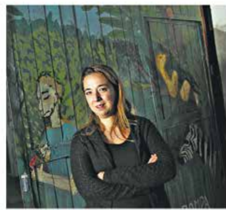
La directora de los Pompapetriyos dice: "El teatro comunitario emerge, crece y madura al hecho social"