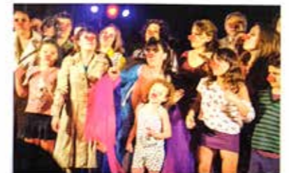
"SOMOS EL BARRIO"

Quando trabajamos la idea de esta merecida nota, nos encontramos una mañana en la sede del grupo de teatro comunitario "POMPAPETRIYASOS" en la esquina de Av. Brasil y Esteban de Luca de nuestro barrio Parque de los Patricios, en busca de material. Sabiendo igual que ellos poseen una hermosa página en internet llena de textos y fotografías, pero era necesario transmitir un contacto personal ya que este es un espacio donde los dueños del arte juegan y juegan. En medio de la charla con quien se ocupa de la prensa del grupo, un señor joven con sus dos hijos, se acercó a preguntar por las actividades del lugar y recibió gratuitamente la información de las muchas tareas con las que el grupo convoca la ilusión de los chicos. Recordamos que una vez alguien dijo "el mundo es de los jóvenes pero por sobre todo de los más jóvenes", de los niños, por quienes, los POMPAPETRIYASOS se juegan día a día logrando a través de su arte que esos niños fortalezcan su identidad familiar, su pertenencia al barrio.