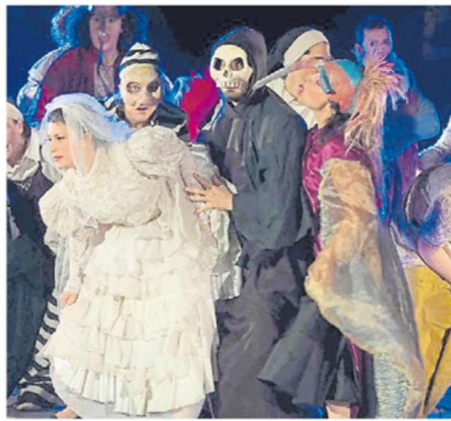
En escena. El grupo teatral comunitario celebra sus 15 años.

Es el Parque Florentino Ameghino. Allí Los Pompapetriyazos representan la obra "Lo que la peste nos dejó".