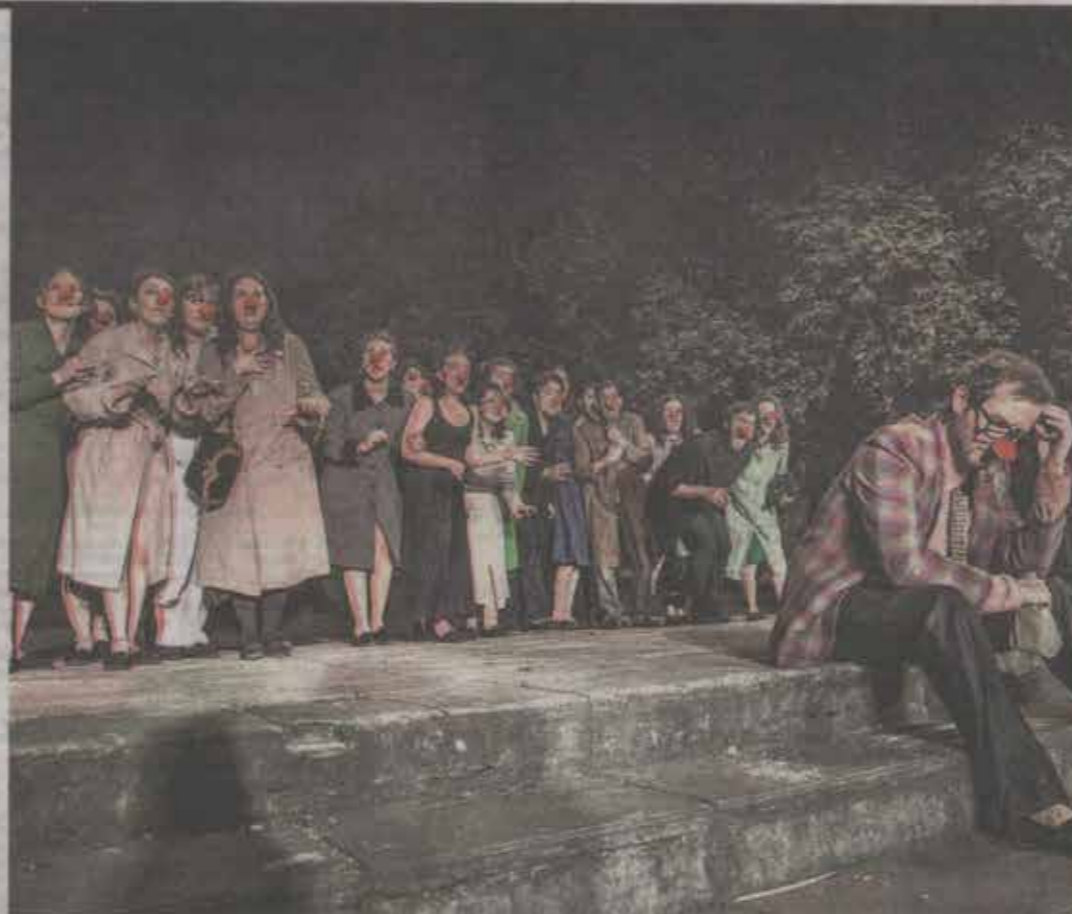
Lo que la peste nos dejó. El grupo de teatro comunitario de Parque Patricios recrea en el Parque Ameghino el pasado del lugar. Era 1871 en el Cementerio del Sur, donde enterraron a las víctimas de la fiebre amarilla. El espectáculo habla de exclusión y de muerte, pero utilizando el humor. Parque Ameghino (Parque Patricios). Hoy a las 20.30. Últimas funciones. A la gorra