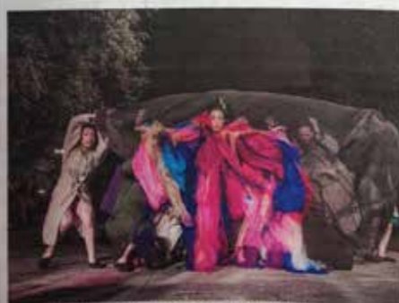
Lo que la peste nos dejó. Una obra en el Parque Ameghino.

La epidemia de la fiebre amarilla vuelve a resurgir en el Parque Ameghino, que supo ser, hace muchos años, el primer cementerio del sur. Y la trae el grupo de teatro comunitario Pompapetriyazos. Vecinos del barrio de Parque Patricios, para esta obra decidieron "escuchar las historias que el parque tenía para contar, y resignificarlas poéticamente". El resultado es Lo que la peste nos dejó , un espectáculo que se puede ver todos los sábados a las 21 (hasta el 17/12) en el corazón del parque que, bajo la luna, nos permite ir y venir en el tiempo de la mano de 50 actores y música en vivo. La historia: un simulacro de filmación de una película en vivo realizada por payasos y en el que se incluye al espectador como extra, con el parque y sus historias como testigos en el medio de la noche.