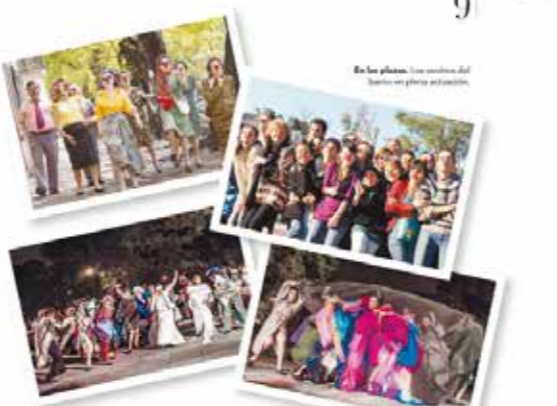
En las plazas, los vecinos del barrio se ponen a actuar